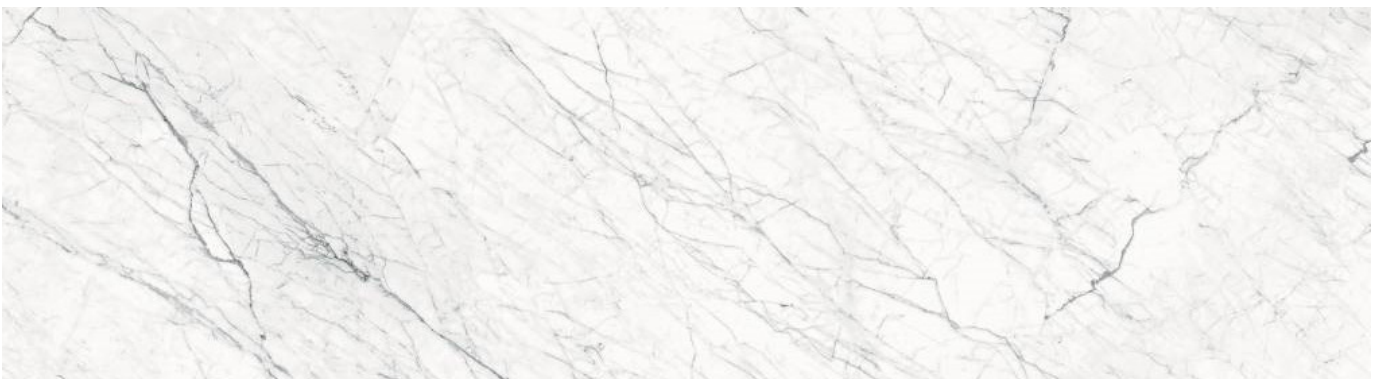
CB 044 Keramik Rietto