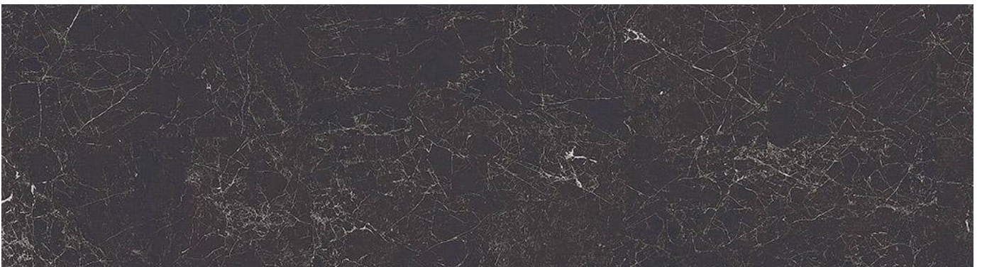
CB 047 Keramik Greco