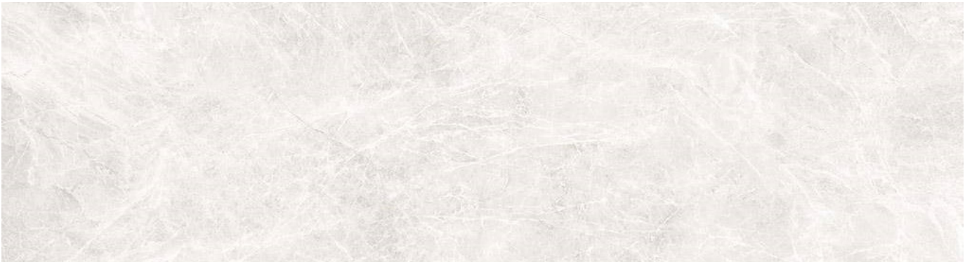
CB 045 Keramik Cream